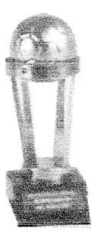
"COPA INTERCONTINENTAL" 1979 CAMPEON