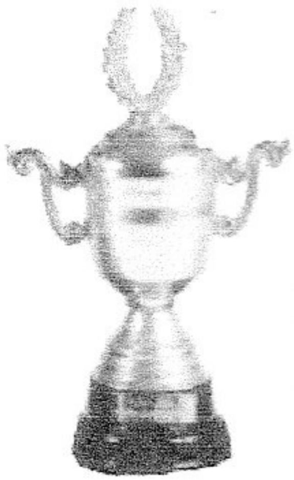
"SUPER COPA" 1990 CAMPEON