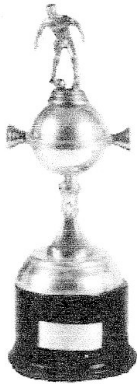
"COPA LIBERTADORES DE AMÉRICA" 1960 VICE CAMPEON 1979 CAMPEON 1989 VICE CAMPEON 1990 CAMPEON 1991 VICE CAMPEON 2002 CAMPEON